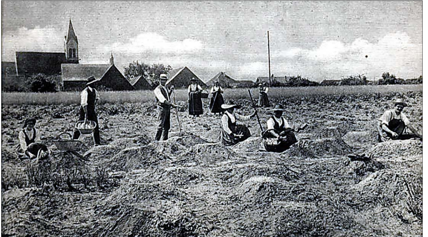
1928 schlummerte die Königin der Gemüse im elsässischen Spargeldorf Hoerdtd bis zum Stechen noch in 30 Zentimeter hohen Hügel, den sogenannten „Sparichelhüfte“ – heute gedeiht der Spargel auf den Feldern in langen Dämmen.