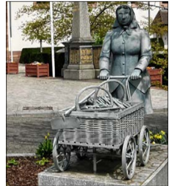
Die steinerne Spargelbäuerin von Hoerdtd.

Zu dieser Zeit gab es da ein Dutzend Spargel-Restaurants. Von Anfang der 70er Jahre bis 2008 wurde alljährlich eine Spargel-Verkostung für die „Gschwollene“ organisiert, bei der Vertreter der Mitgliedsländer des Europarats sowie europäische Parlamentarier im Restaurant „À la Charrue“ zusammenkamen.